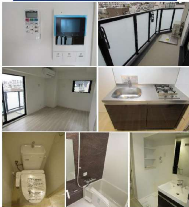
※退去前の前回募集時のお写真です

☆敷金礼金0円☆ インターネット無料 オートロック・TVモニターホンで安心！ 浴槽乾燥機あり！