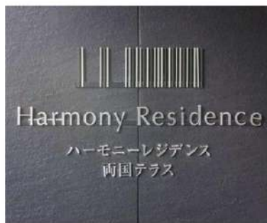
外観写真 イメージ