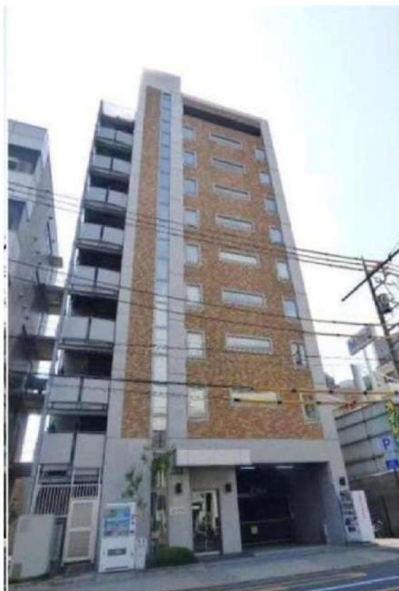
外観写真 イメージ