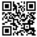
IoT 対応 イメージ動画