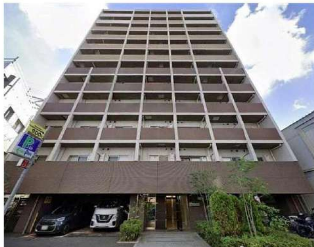
外観写真 イメージ