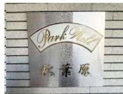
外観写真 イメージ

新宿本店 新宿区新宿3-21-4新宿ニュータワービル1階 TEL:03-6279-2032