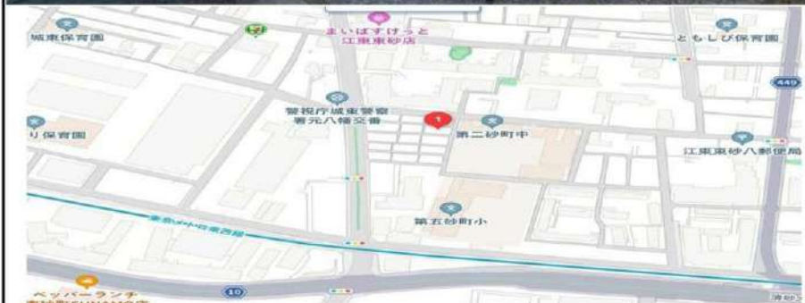
※図面と現状が異なる場合には現状優先と致します。