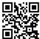
IoT 対応 イメージ動画