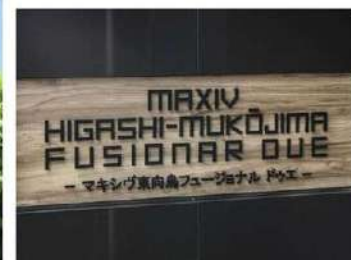
外観写真 イメージ