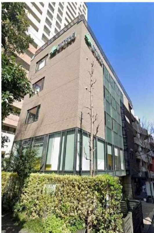
外観写真 イメージ