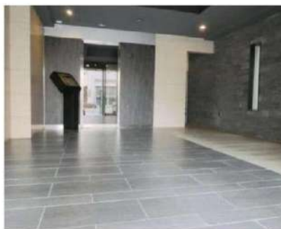
外観写真 イメージ