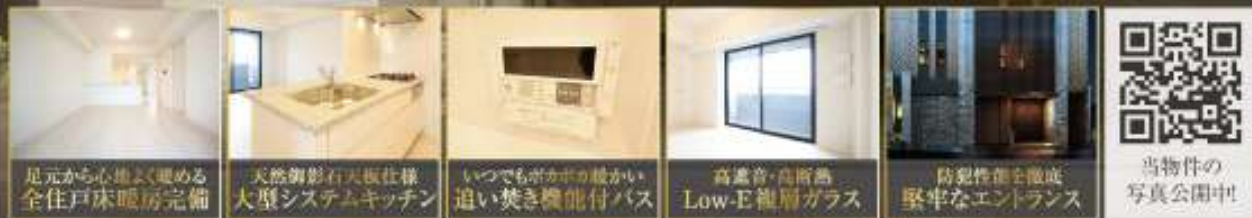
足元から心地よく暖める 全戸床暖房完備