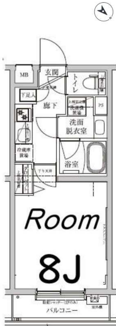
図面と現況が異なる場合は現況を優先します