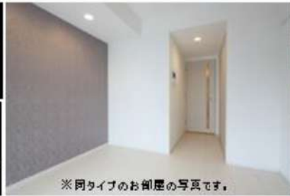
※同タイプのお部屋の写真です。