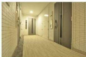
カスティア高輪台廊下