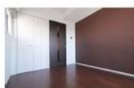
写真等のイメージはあくまでイメージです。実際の状態には差異が生じておられます。