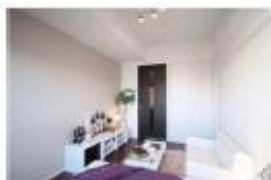
写真等のイメージはあくまでイメージです。実際の状態には差異が生じておられます。