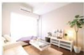
写真モデルルームです。実際の状態には差異が生じておられます。