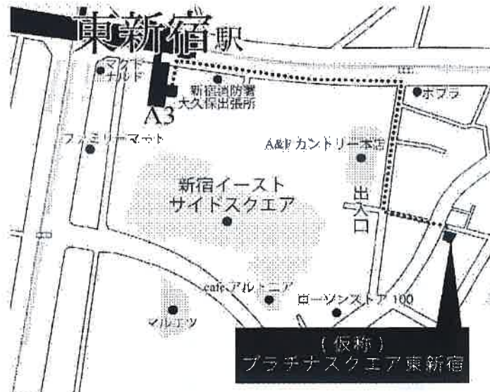
(仮称) プラチナスクエア東新宿